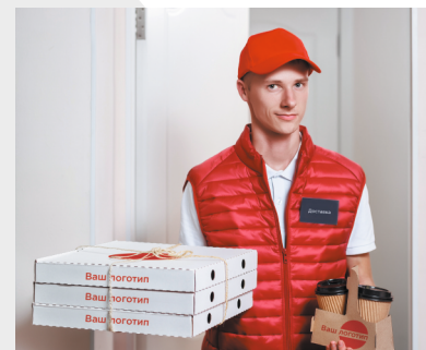
Доставка готовой еды